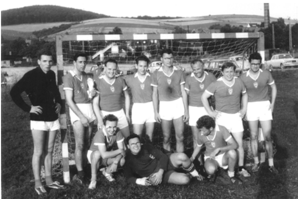
1. Männermannschaft 1959