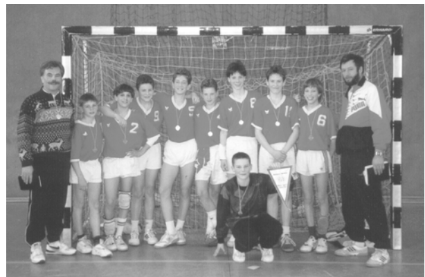
Männliche D-Jugend: Berliner Meister 1995