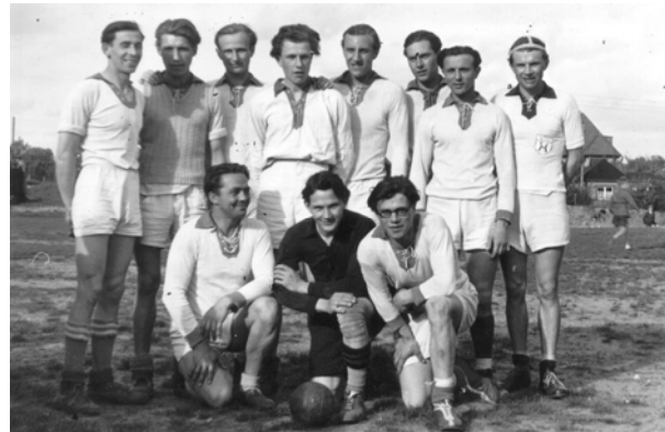
1. Männermannschaft 1949

Stadtmannschaft gehörte. Wer im Jahre 1949 in der ersten Männer- und Frauenmannschaft spielte, zeigen die beiden Mannschaftsbilder; alle Namen ließen sich nicht mehr rekonstruieren.