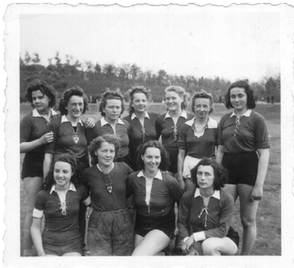
1. Frauenmannschaft 1949