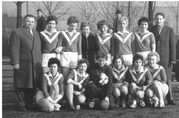
1. Frauenmannschaft 1959

Aus dieser Zeit gibt es auch wieder Berichte in der „Rot-Weiß“. 1959 stieg beispielsweise die - inzwischen einzige - Männermannschaft immerhin aus der 2. in die erste Kreisklasse auf; die Frauen wurden eine Klasse höher, in der Bezirksliga, Zweite. Es gab außerdem noch zwei Jugendmannschaften. Trainiert wurde in der Turnhalle in der Fellbacher Straße (damals noch Kaiserstraße), in der nicht einmal Tore standen.