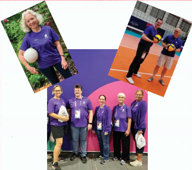
Die VfB-Volunteers bei den Special Olympics