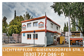
LICHTERFELDE - GIESENSDORFER STR. 1 (030) 772 046 - 0