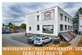
WEISSENSEE - FELDTMANNSTR. 152 (030) 927 033 - 0