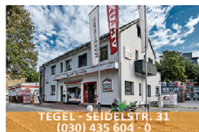
TEGEL - SEIDELSTR. 31 (030) 435 604 - 0