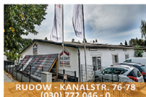
RUDOW - KANALSTR. 76-78 (030) 772 046 - 0