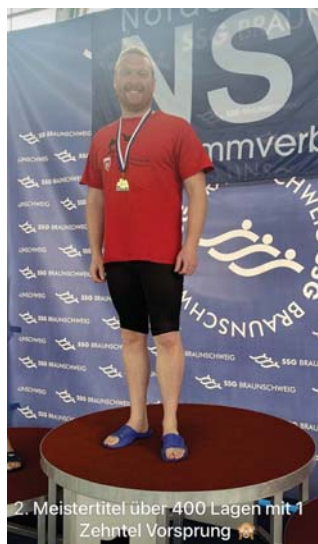
2. Meistertitel über 400 Lagen mit 1 Zehntel Vorsprung 🏆