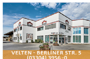
VELTEN - BERLINER STR. 5 (03304) 3956 - 0

ALLE INFORMATIONEN AUF WWW.BORCHERT-BERLIN.DE