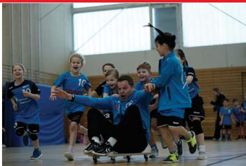
22. Wuselturnier der Handballer am 7. März